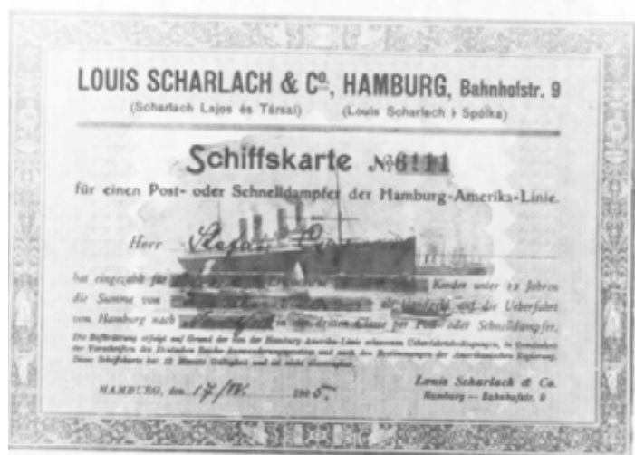
Obrázok 1 Lodný lístok

Keď boli so všetkým pripravení, vydali sa Ľubelci na ďalekú cestu. Často ich sprevádzal agent lodiarkej spoločnosti, ktorý im pomáhal orientovať sa v novej neznámej situácii. Veľká väčšina vystaňovalcov cestovala železnicou južnejšou trasou do prístavu Brémy (146 osôb), menej ich cestovalo severnejšou trasou cez územie Poľska a Nemecka do