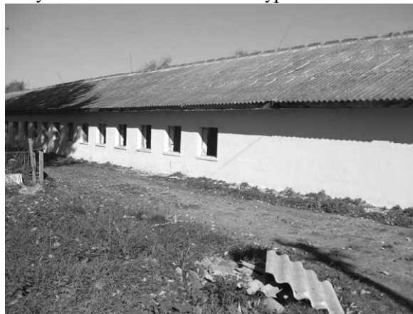
Zrekonštruovaná hospodárska budova

môžu byť vlastníci formou naturálií vyplatení.