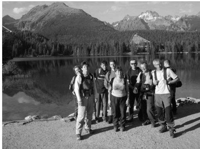
Štrbské Pleso 2007

A naše plány? Prvým krokom k lepšej propagácii bude, že budeme o sebe informovať na internetovej stránke www.lubela.sk . Návštevníci stránky tam nájdu aj zábery z našich akcií. Ďalšie plány sú „obyčajné“, získať nových ľudí a mať dobré podmienky pri túrach, aby nás turistika čo najviac tešila.