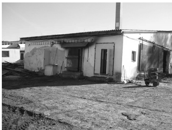
Pec na ekologické vykurovanie

Kombajny zrno podrvi a zrno v takomto stave sa konzervuje vo vákuu, ktorý sa hermeticky uzavrie.