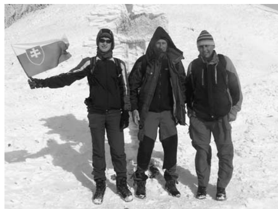
Belianske Tatry 2007