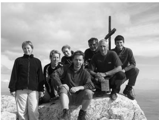
Slavkovský štít 2007