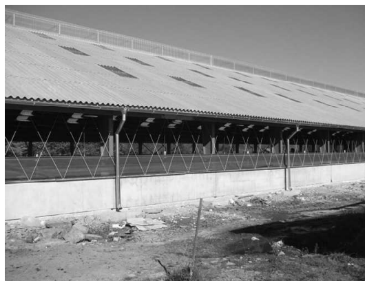
Nová maštaľ pôsobí omnoho estetickéjšie

Spomenul som, že projekt na výstavbu farmy bol vypracovaný na obdobie 2007 – 2013. Plánujeme vybudovanie hnojnej koncovky, 2 silážne žľaby, vonkajšie kŕmenie, natretie strechy na bývalej sociálnej budove, úpravu okolia.