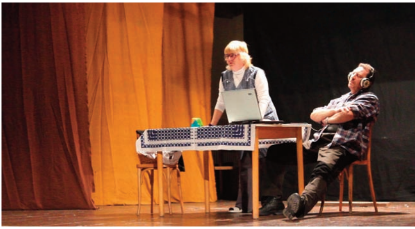
Celá dedina „hore nohami“

Fašiangy v Lubeľi už tradične ukončilo pochovávanie basy. Na pohrebe sa stretli partizáni, baníci či cigáni. Diváci si užili poslednú dávku smiechu a zábavy pred štyridsať dňovým pôstom.